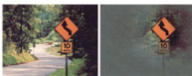
Campo de visão normal Campo de visão anormal

Glaucoma crônico de ângulo aberto ocorre em 80% dos casos e não apresenta sintomas no início. No entanto, se não for tratado precocemente, com o passar dos anos, o paciente pode perder totalmente a visão.