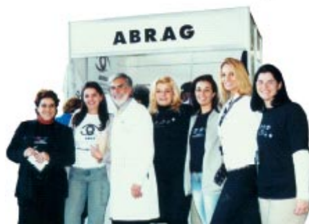
Equipe ABRAG e convidados em ação.

VEJA O BALANÇO POSITIVO DO DIA NACIONAL DE COMBATE À CEGUEIRA PELO GLAUCOMA.